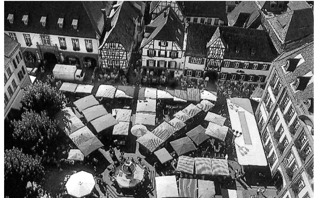
Blick auf den Marktplatz